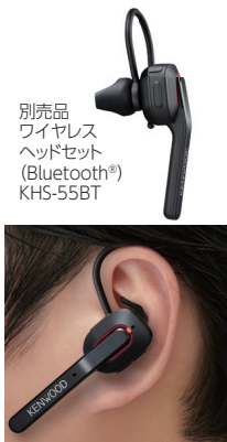
別売品 ワイヤレス ヘッドセット (Bluetooth®) KHS-55BT

TPZ-D563BTはBluetooth®を搭載したことで、PTT付きワイヤレスヘッドセットKHS-55BTに対応。KHS-55BTはPTTモード、PTTホールドモードおよびVOX運用が可能。PTTモードでは無線機本体のPTTと同じ操作感で使えます。ケーブルを気にすることなく、約3時間の充電で通常約8時間 (Bluetooth電池セーブON時約12時間) 運用できるため、一日の使用にも耐えられます。また、PCとのワイヤレス接続により無線機の設定が容易に変更できます。