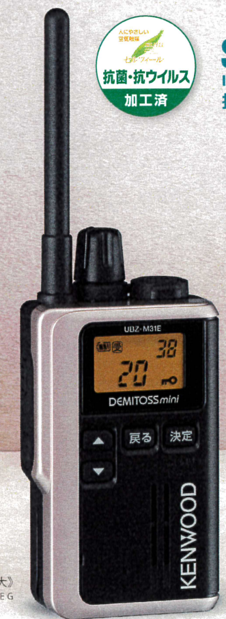
【実物大】 UBZ-M31E G